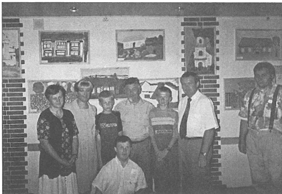
Wernisaż prac plastycznych z I Pleneru Integracyjno - Kulturalnego