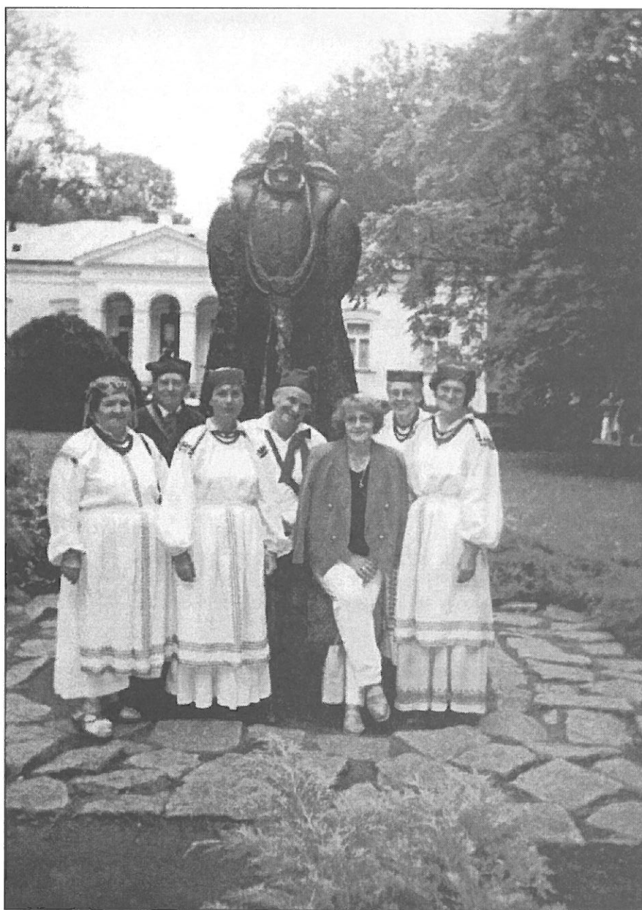
Kapela Ludowa z Tarnobrzegu w czasie imprezy czarnoleskiej „Imieniny Pana Jana Kochanowskiego”

W dniach 5,6,7 czerwca 160 uczniów ZSE w Tarnogrodzie pod opieką nauczycieli wypoczywało na biwaku w Majdanie Sopockim.