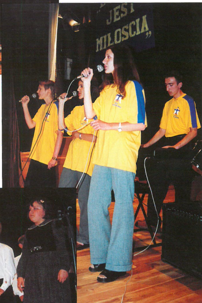
Zespół KSM „Przyjaźń” z Woźuczyna