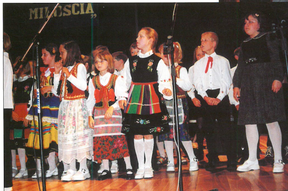
Zespół Pieśni i Tańca „Marysieńka” z Tarnogrodu