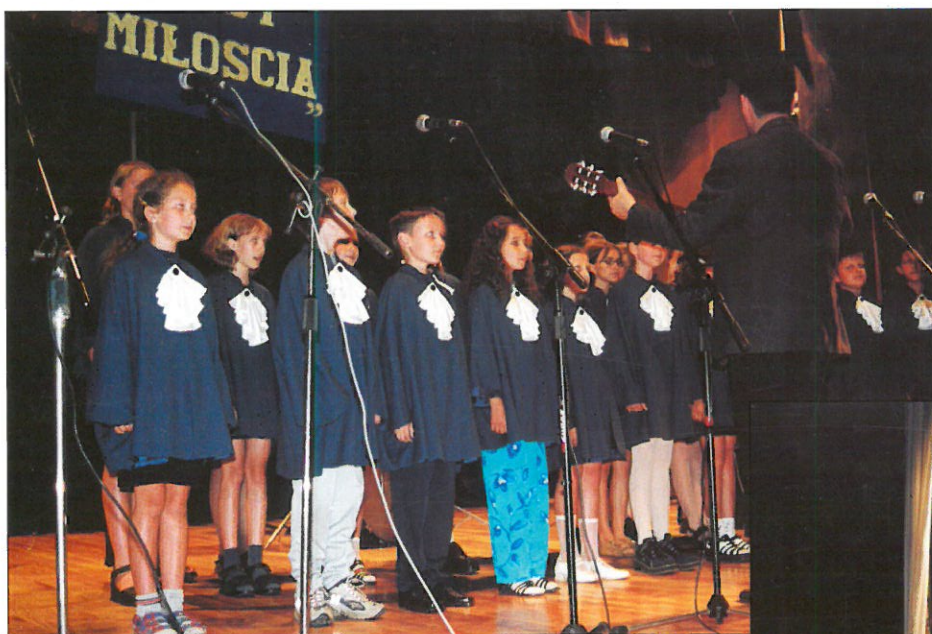
Zespół „AWE” z Zamościa