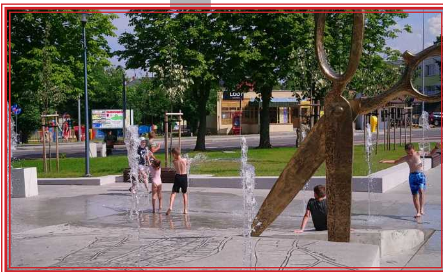
„Skwer Gryfa”. Lipiec 2023

w Luchowie Górnym, Szkoły Podstawowej w Luchowie Dolnym, Szkoły Podstawowej im. Kardynała Stefana Wyszyńskiego w Różańcu Drugim oraz Szkoły Podstawowej w Woli Różanieckiej, Wystąpiły Zespoły Taneczne i Zespół Wokalny Tarnobrodzkiego Ośrodka Kultury.