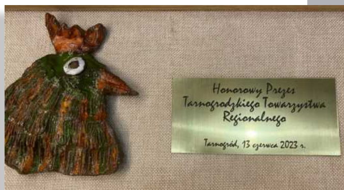
Pamiątka dla Honorowego Prezesa Tarnogrodzkiego Towarzystwa Regionalnego