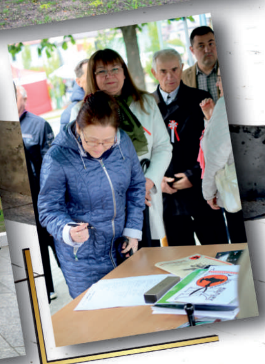
„SKWER GRYFA”. Otwarcie placu i nadanie nazwy. Mieszkańcy i zaproszeni goście składają podpisy w liście do potomnych umieszczonym w kapsule czasu. 3 maja 2023