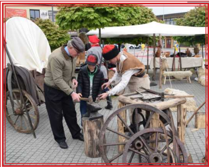
Rekonstruktorzy powstania styczniowego

na rynku uczestnicy mogli obejrzeć sprzęt wojskowy