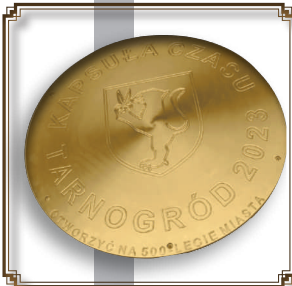
Pokrywa kapsuły czasu