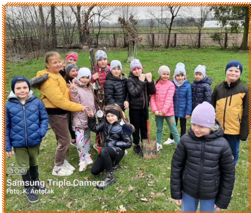
Samsung Triple Camera

12.04.2023 r. posadziliśmy je na placu szkolnym. Podczas tej pracy pomógł nam jeden z rodziców i wychowawczyni klasy 2. Dzieci dowiedziały się, w jaki