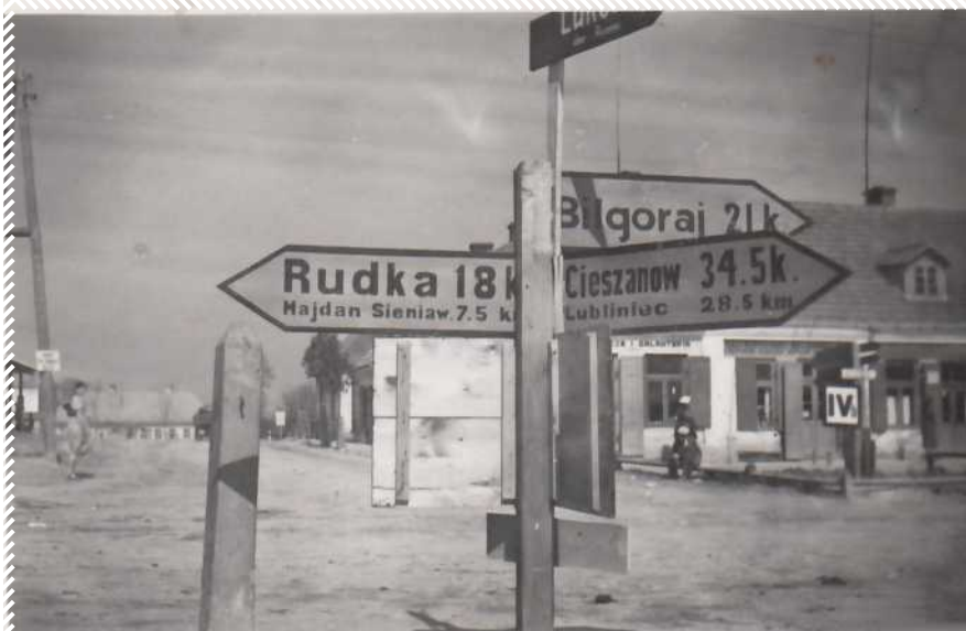
Skrzyżowanie dróg w Tarnobrzegu. Okres wojenny

Akcję tę starannie zaplanowano. Dzieci do lat 10 miały