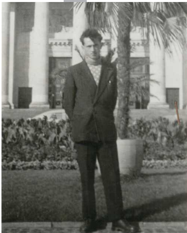
Przed nowo oddanym do użytku Pałacem Kultury [ówczesny (do 1956) Pałac Kultury i Nauki im. Józefa Stalina]

Wyjątkowość tego teatru – nazywanego potocznie „obrzędowym” – polega na tym, że wszystko, co dzieje się na scenie jest nie tylko spektaklem – jest przechowywaniem rdzennej kultury polskiej, przywracaniem jej obecności w kulturze współczesnej. W takim klimacie właśnie w