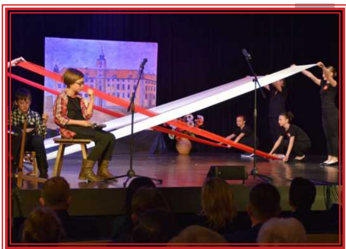
Program patriotyczny w wykonaniu uczniów Szkoły Podstawowej im. Marii Curie-Skłodowskiej w Tarnobrodzkiem

Na placu przed Tarnobrodzkim Ośrodkiem Kultury grupa rekonstrukcji historycznej Małogoski Oddział Powstańcy 1863 r. – Klub Historyczny DK Małogoszcz przeprowadziła nieszablonoową lekcję historii o roku 1863/64 pt. „A gdy na wojenkę szli ojczyźnie służyć”. Oprócz rekonstrukcji