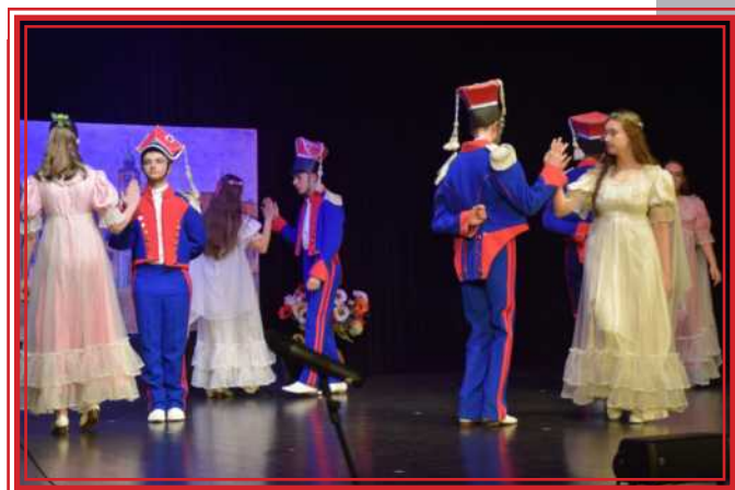
Polonez w wykonaniu uczniów Szkoły Podstawowej w Luchowie Dolnym

Na placu przed Tarnobrodzkim Ośrodkiem Kultury grupa rekonstrukcji historycznej Małogoski Oddział Powstańcy 1863 r. – Klub Historyczny DK Małogoszcz przeprowadziła nieszablonoową lekcję historii o roku 1863/64 pt. „A gdy na wojenkę szli ojczyźnie służyć”. Oprócz rekonstrukcji