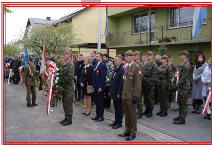
Uroczystości przy kopcu Tadeusza Kościuszki

Po mszy został odśpiewany przy akompaniamencie orkiestry hymn narodowy i wciągnięta na maszt flaga z udziałem Wojskowej Asysty Honorowej. Następnie